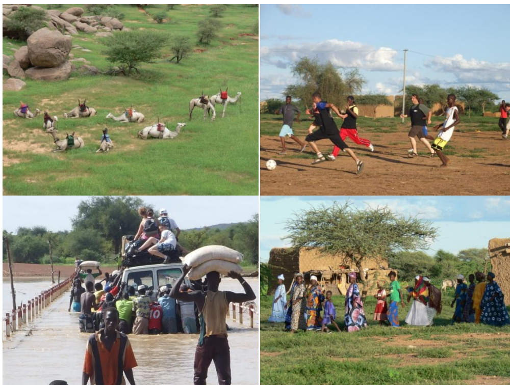
« Les jeunes au Sahel- août 2007 »