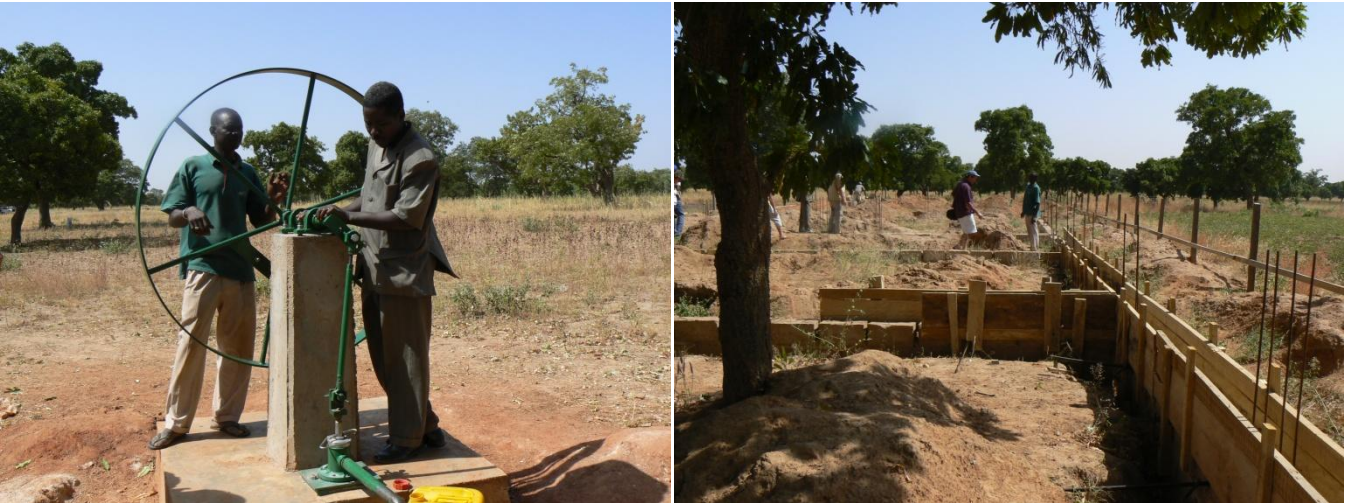
« La pompe et les fondations, sur le terrain à Tanghin Dassouri »

Lors de notre visite sur le terrain début novembre 2007, nous avons pu constater la réalisation des fouilles et des fondations en béton. Elles accueilleront les murs du premier bâtiment destiné aux salles de cours et aux magasins.